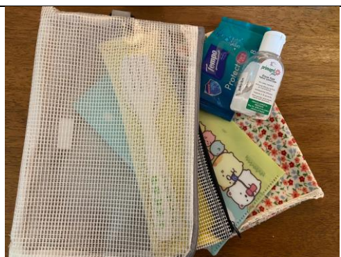
把餐具及消毒用品放進透明輕便袋，並寫上姓名