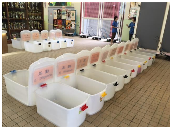
把飯盒放在適當的班別，要清楚寫明姓名及班別在飯盒上，以資識別。